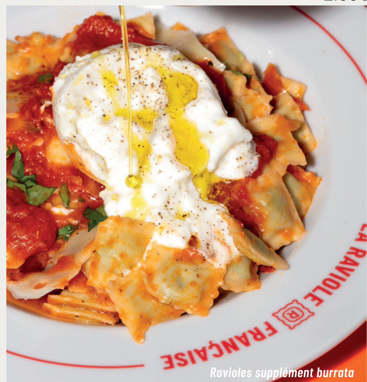
Ravioles supplément burrata