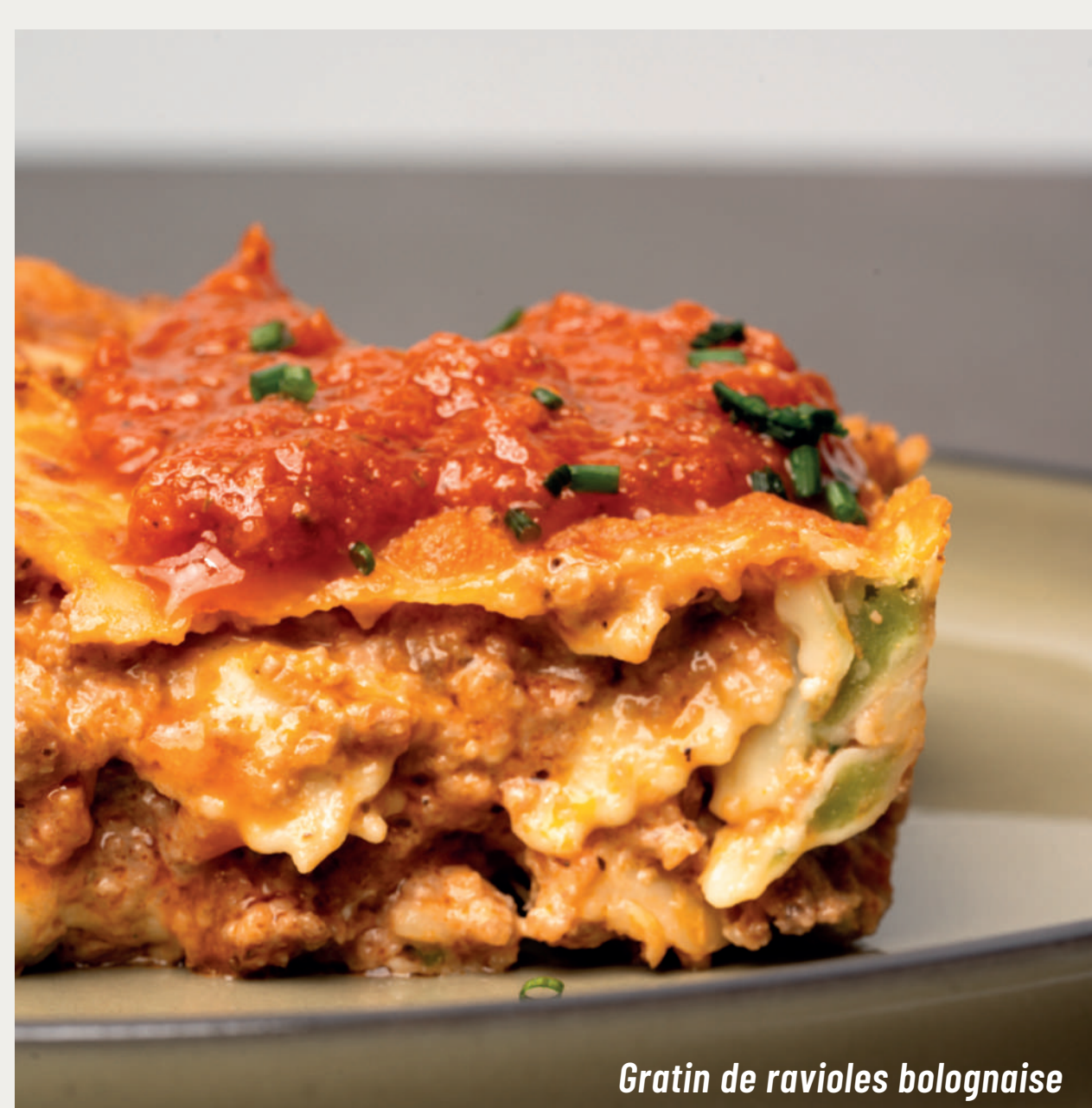
Gratin de ravioles bolognaise